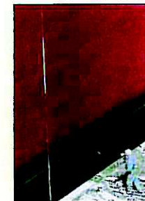
Nettoyage de structures avant peinture